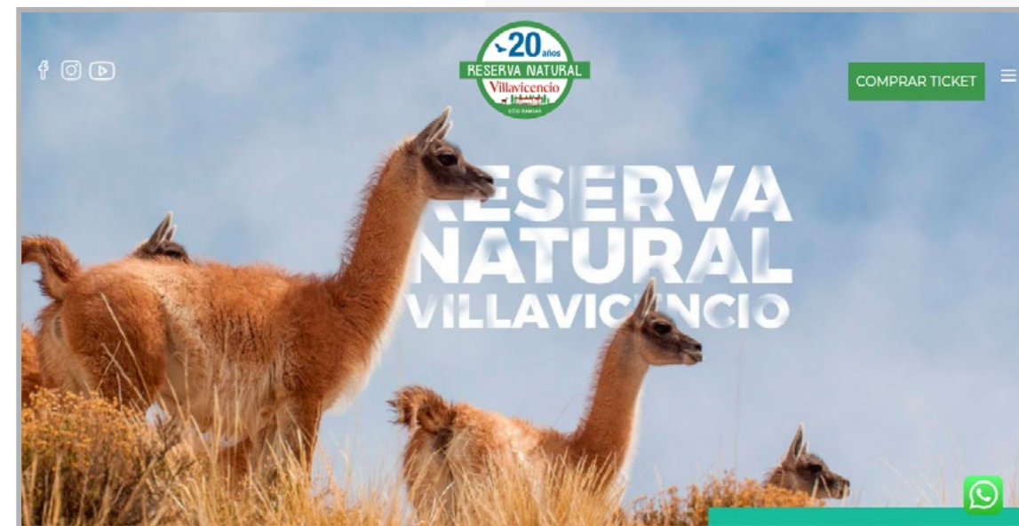
RESERVA NATURAL VILLAVICENCIO Pagina web