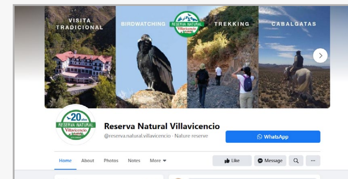
RESERVA NATURAL VILLAVICENCIO Facebook fan page